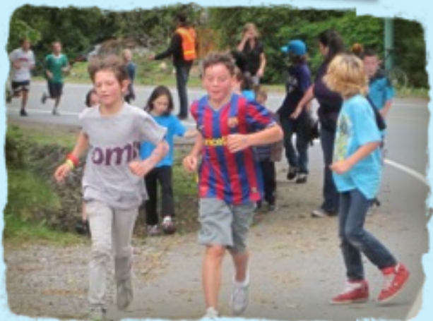
Bonne course tout le monde!

Merci à tous les parents qui sont venus aider lors de la course Terry Fox!