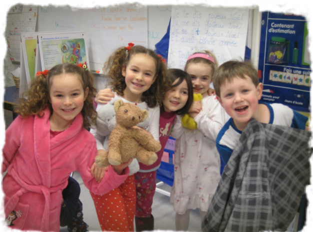
Journée Pyjama, classe de M/1e